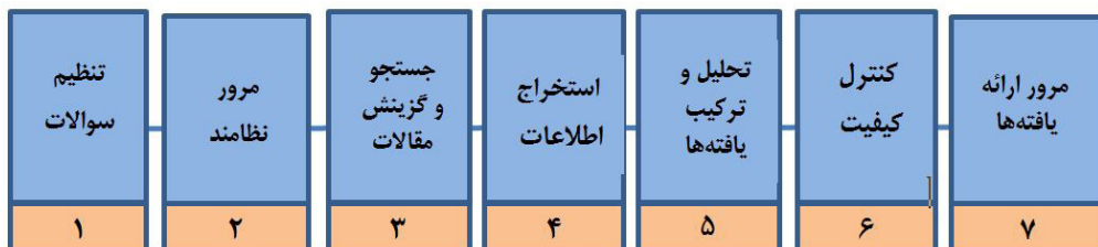
شکل ۱. مراحل اجرای پژوهش