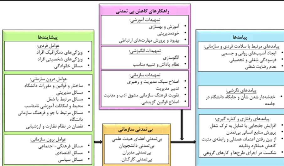
شکل ۱. شبکه مضامین بی‌تمدنی سازمانی در دانشگاه‌ها