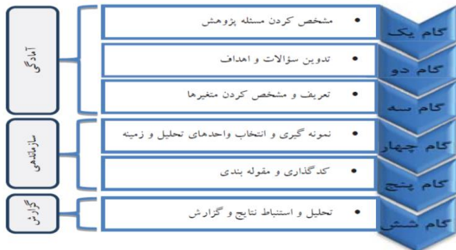
شکل ۱. مراحل تحلیل محتوای کیفی

در آموزش، صبر و فواید آن بود. بر این اساس روند بررسی بدین شرح است ابتدا به تحلیل قرآن و سپس به بررسی نهج‌البلاغه ترجمه سیدرضی پرداخته شد. از آن‌جا که معیارهای دقت در تحلیل محتوی کیفی شامل اعتبار، انتقال‌پذیری و قابلیت تأیید می‌باشد. برای تعیین اعتبار از راهبرد بازبینی مشارکت‌کنندگان و بازبینی متخصصان استفاده شده است. به این منظور کدگذاری تحلیل در اختیار سه پژوهشگر قرار گرفت که ضریب توافق ۰/۸۹ برآورد شد. برای سنجش بازبینی مشارکت‌کنندگان علاوه بر بازگرداندن گفتار و تجربیات صاحب‌نظران و متخصصان در طول مصاحبه، متن کامل کدها و طبقات در اختیار ۵ نفر از متخصصان قرار گرفت و نظرات ایشان در اصلاح و یا تأیید مورد استفاده قرار گرفت. برای بررسی انتقال‌پذیری نیز متن کامل به همراه کدها و طبقات در اختیار سه تن از اعضا قرار گرفت. هم‌چنین در ارتباط با تأییدپذیری فرایند تلاش گردید تا کلیه فعالیت‌ها به دقت ثبت گردد. جهت رعایت شرایط اخلاقی ضمن ایجاد جو صمیمی در گروه سعی گردید تا رضایت ایشان جهت شرکت در گروه جلب گردد. تحلیل محتوایی تحقیقات کیفی از طریق فرایند طبقه‌بندی نظام‌مند، کدها و طبقات مستقیماً و به صورت استقرایی از داده‌های خام استخراج می‌شوند. بنابراین سه مرحله اصلی در فرایند انجام تحلیل محتوا اسنادی باید طی شود از جمله؛ آماده شدن برای تحلیل، سازماندهی و در نهایت گزارش نتایج به دست آمده.