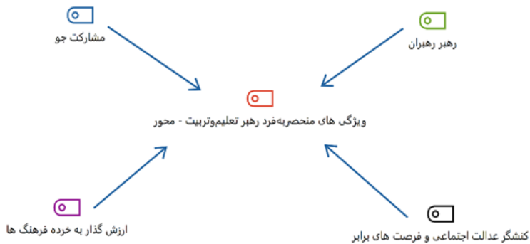
شکل ۲. ویژگی‌های منحصر به فرد یک رهبر تعلیم و تربیت محور